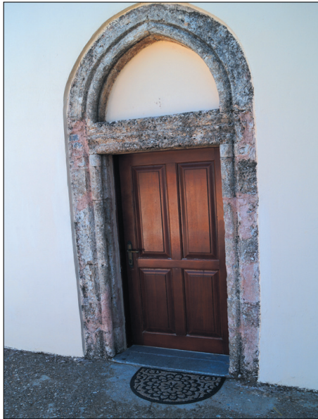
Η είσοδος του ναού (δυτική πλευρά)

Στο σημερινό φύλλο της εφημερίδας παρουσιάζουμε ένα έγγραφο του 1876 από το Αρχείο της Δημογεροντίας Λασιθίου με ιστορικές πληροφορίες για το ναό, αλλά και τα πρόσωπα που υπηρετούσαν τότε τη Φουρνή, Επάνω & Κάτω, ως ιερείς, έφοροι και δημογέροντες.