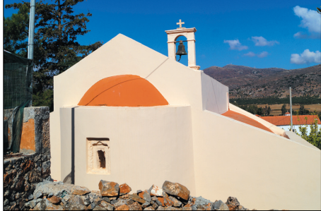
Ο ναός του Αγ. Ιωάννη του Θεολόγου στην Επάνω Φουρνή από τα ανατολικά

Ο ναός Αγίου Ιωάννη του Θεολόγου βρίσκεται στο νότιο άκρο του οικισμού της Επάνω Φουρνής. Είναι ναός βενετικής περιόδου δομημένος με επικλινείς στέγες χωρίς κολώνες. Ήταν μοναστήρι με υποστατικό και κελιά, παράρτημα της Μονής του Αγ. Κωνσταντίνου Δωριών. Σύμφωνα με τη Δάφνη Χρονάκη είναι ναός πρώιμης βενετοκρατίας με τεχνοτροπία που παραπέμπει σε παλιότερη εποχή, ενώ σύμφωνα με το Μιχαήλ Πατεράκη είναι του 14ου αιώνα.