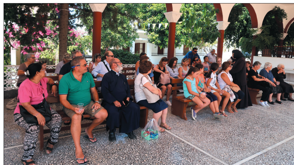
Οι εκδρομείς στην Καλυβιανή κατά την ξενάγηση από τη Μοναχή

χρησιμοποιούνταν για τελετές λατρευτικού χαρακτήρα όπως τα Ταυροκαθάψια. Στοιχεία για την ιστορία της αρχαίας πόλης ήρθαν στο φως έπειτα από Ιταλικές αρχαιολογικές ανασκαφές. Οι ανασκαφές ξεκίνησαν το 1900 από την Ιταλική Αρχαιολογική Σχολή υπό την καθοδήγηση των Federico Halbherr και Luigi Pernier, ενώ το 1950-71 ανέλαβε ο