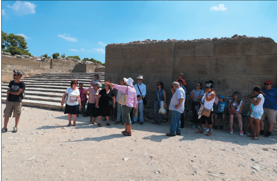
Οι εκδρομείς κατά την ξενάγηση στη Φαιστό

ψωμένο επίπεδο του, λόγω της ύπαρξης των ερειπίων. Η κεντρική αυλή των ανακτόρων είχε παρόμοιες διαστάσεις με τις αυλές της Κνωσού και των Μαλλίων και ενδεχομένως