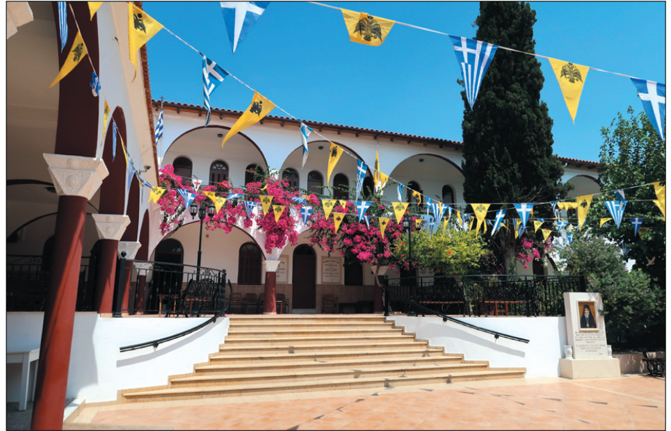
Η Ιερά Μονή της Παναγίας της Καλυβιανής

Στη συνέχεια αποχαιρέτησα τη Φαιστό και διασχίζοντας τον κάμπο της Μεσσαράς κατευθυνθήκαμε στον επόμενο προορισμό